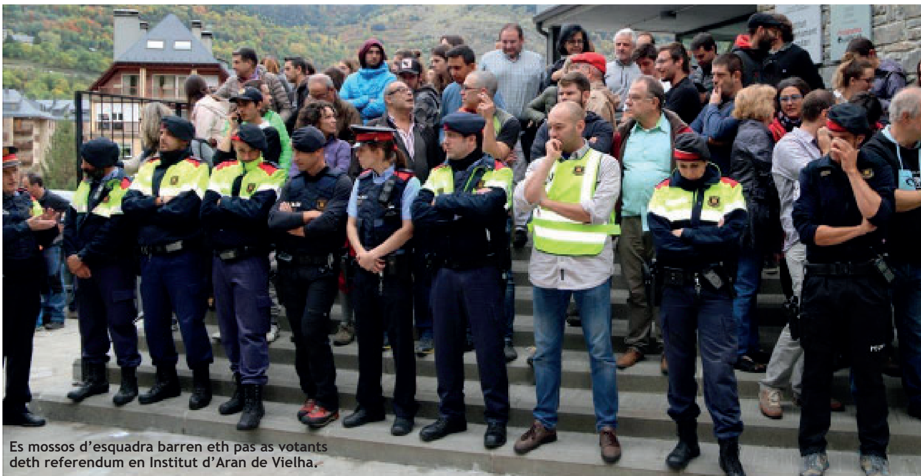
Es mossos d'esquadra barren eth pas as votants deth referendum en Institut d'Aran de Vielha.