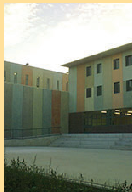
12. Centre Penitenciari Puig de les Basses / Raval disseminat, 53 de Figueres.