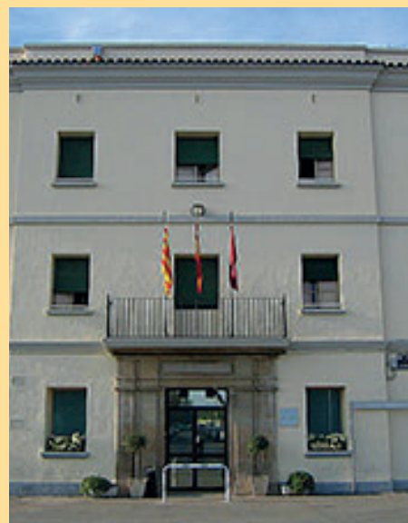
7. Centre Penitenciari Obert de Lleida / Victòria Kent, s/n de Lleida.