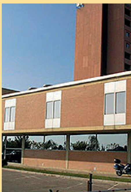
14. Pavelló Hospitalari Penitenciari de Terrassa / Carretera de Torrebónica s/n de Terrassa. Dins del complex de l'Hospital de Terrassa.

Fora del sistema penitenciari i dirigit des de l'Estat a Barcelona hi ha un Centre que per qualsevol demòcrata és una "autèntica presó" que vulnera els Drets Humans i els de la Solidaritat : és el Centre d'Internament per a Persones Estrangeres, el CIE , situat al barri de la Zona Franca. És un centre no penitenciari on s'interna les persones estrangeres que han estat detingudes per trobar-se en situació administrativa irregular -no tenir papers - abans de ser expulsades. Moltes vegades s'ha denunciat la vulneració de drets al CIE, falta de transparència i s'està demanant el seu tancament.