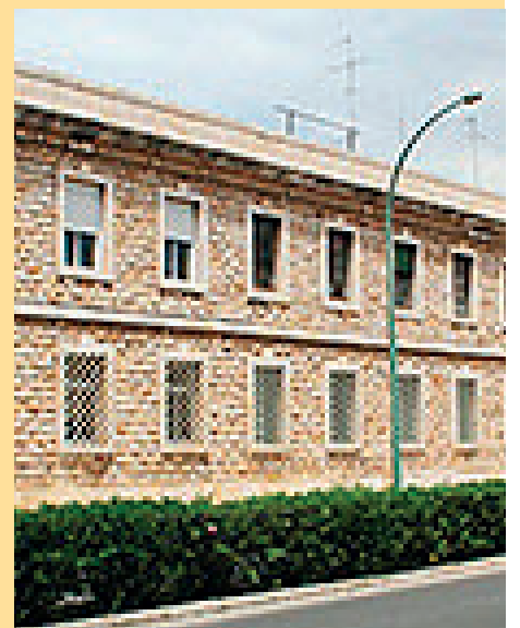
8. Centre Penitenciari Obert de Tarragona / Av. República Argentina, 2 de Tarragona.