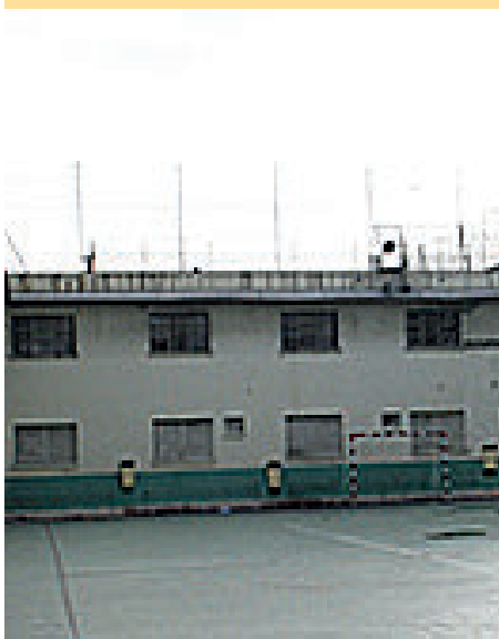
5. Centre Penitenciari Obert 2 de Barcelona / Carrer Pare Manjón, 2 de Barcelona.