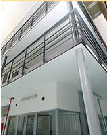
1. Centre Penitenciari Brians 1 / Carretera de Martorell a Capellades, km 23a Sant Esteve Sesrovires.