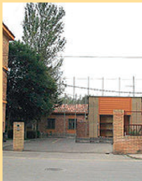
6. Centre Penitenciari Obert de Girona / Carrer Menorca, 16 de Girona.