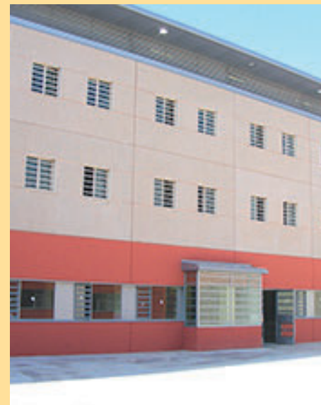
4. Centre Penitenciari de Joves / Carretera del Masnou a Granollers, km 13,425 a La Roca del Vallès.