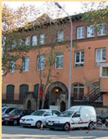
3. Centre Penitenciari de Dones de Barcelona / Carrer Doctor Trueta, 76-98 de Barcelona (Coneguda com: la presó de Wad-Ras).