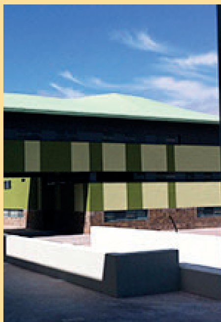
10. Centre Penitenciari Mas d'Enric / Travessia Comella Moro, 15 de El Catllar.