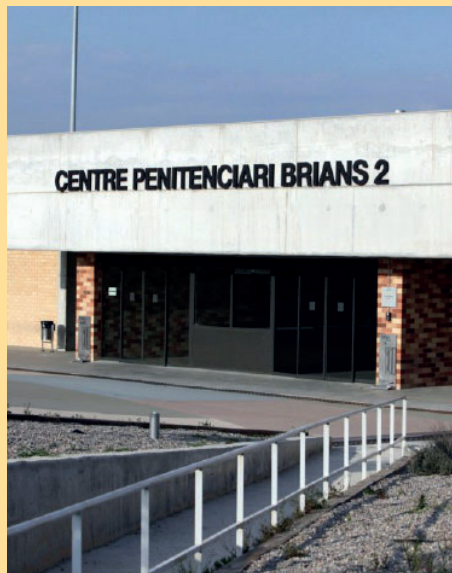
2. Centre Penitenciari Brians 2 / Carretera de Martorell a Capellades, km 23a Sant Esteve Sesrovires.