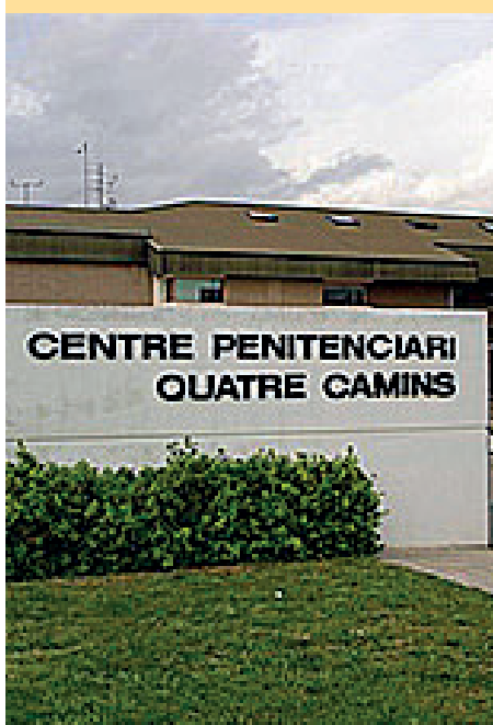
13. Centre Penitenciari Quatre Camins / Carretera del Masnou a Granollers, km 13,425 de La Roca del Vallès.