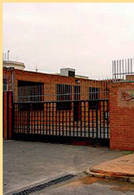
11. Centre Penitenciari Ponent / Carrer Victòria Kent, s/n de Lleida.